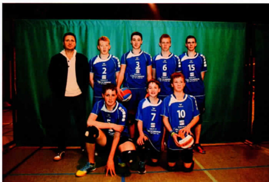
L'équipe Juniors d'ATHENA

BULLETIN DU COMITE PROVINCIAL DU Luxembourg DE L'A.I.F. ASBL