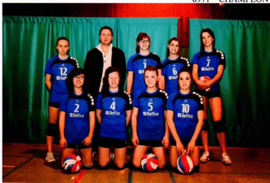
L'équipe Juniores d'ATHENA