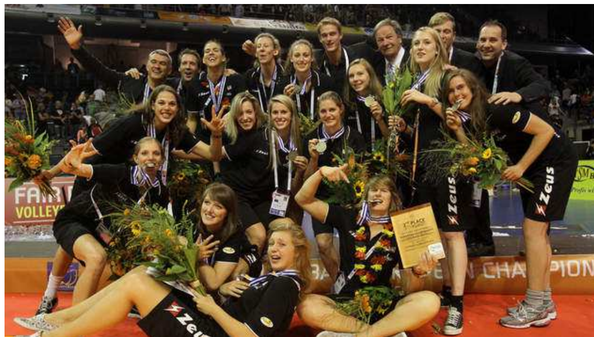
Equipe nationale belge de volley-ball (les Yellow Tigers)

BULLETIN DE L'ASSOCIATION DES CLUBS DE VOLLEY-BALL DU LUXEMBOURG (A. C. V. B. L.) DE L'A. I. F. ASBL